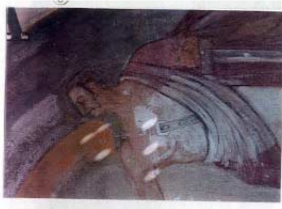
Boia prima del restauro