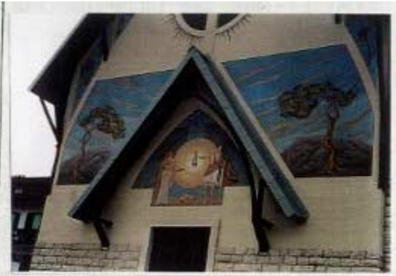
Facciata dopo il restauro