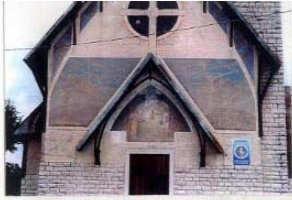
Facciata prima del restauro