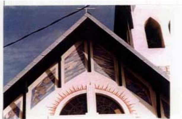
Rosone e decorazioni restaurati

( Estratto dalla relazione tecnica elaborata dai progettisti commissionati dalla Parrocchia di S. Giovanni Battista in frazione Stoccareddo)