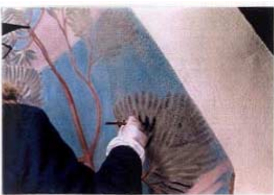
Particolare in esecuzione