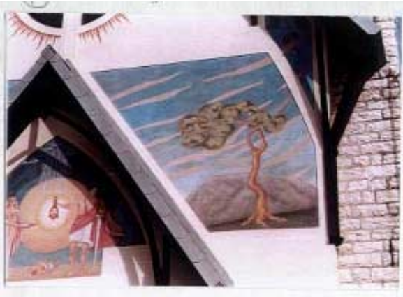
Boia dopo il restauro