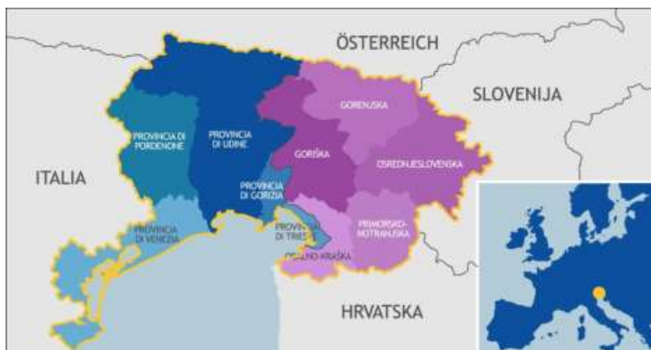
Interreg ITA - SLO Area del Programma / Programsko območje

Kot podpora intervjujem je bilo razvito tudi spletno orodje Automated Assessment Tool (AAT) , ki omogoča zainteresiranim organizacijam ocenitev lastnega potenciala in pripravljenosti za sodelovanje v aktivnostih projekta DIVA, med katerimi velja omeniti predvsem DIVA javni razpis 2020 ( DIVA Open Call 2020 ) za izvedbo pilotnih projektov.