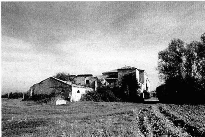
Il complesso edificato visto da ovest (G.T. 1999)

Particolare dell'iconografia del 1649, Loreo (RO). Beni del supplicante Grimani Zuane fu Vettor a sud del centro urbano ed altri possedimenti lungo il Po delle Fornase, o di Levante, ed il ramo di Tramontana, disegno di Sebastiano Roccatagliata, 26 febbraio 1649. ASVe, Provveditori sopra Beni Inculti, disegni Padova-Polesine, 340/12/2