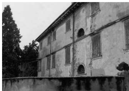
Scorcio della facciata della barchessa prospiciente la corte (Archivio IRVV)