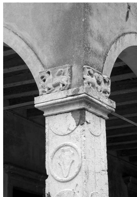
Pianta del piano terra (Cevese 1971) Fianco nord-ovest della casa padronale (N.L.) Fronte nord-est della casa padronale (N.L.) Particolare di un pilastro del loggiato della casa padronale (N.L.)

trapposte sulle pareti del salone, raffiguranti l'epopea napoleonica, affrescate da Pietro Moro, alcuni fregi a stucco e mattonelle di maiolica di stile rococò. Il giardino posteriore è a parterre, con peschiera ovale a sud e scale a rampe mistilinee che ascendono al parco.