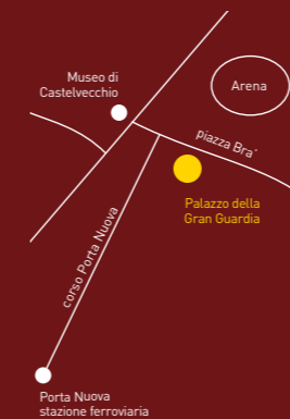
brugliobreggero@labedesign.com - - stampa Grafiche Aurora Verona

Seguire le indicazioni "tutte le direzioni" e "centro".